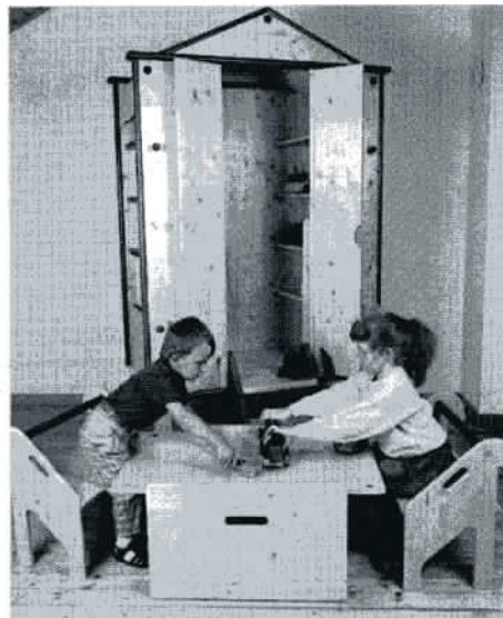
Kreatives Holz: Kleiderhütte „Fantasia“, Kleider- und Spielhaus, aus massivem Fichtenholz, zerlegbar, seitlich abnehmbare Sitze, einziehbare Treppe, Gruppe Holznest, 6 Tischlerwerkstätten + 1 Designer, 8755 St. Peter/Judenburg